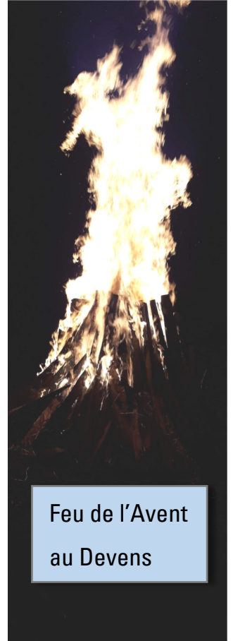
Feu de l'Avent au Devens