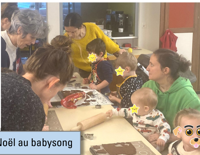
Noël au babysong